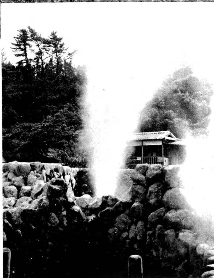
上 別府引湯泉源の一（奥村鹿太郎氏所有） 下 ホーリングカによる噴氣（八幡地獄）