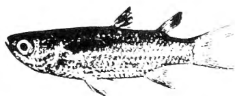
オニボラ Liza vaiigiensis (Quoy et Gaimard)