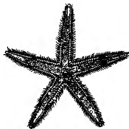
クロスジモシガイ Astropecten polyacanthus Müller et Troschel