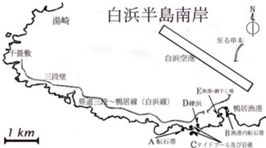
図1. オニヒトデ調査を実施した和歌山県西牟婁郡白浜町の鴨居漁区海岸の5箇所(A-E地点)

上記に加え、(4) 2002年6月から2010年1月まで、1月～2月の各日曜日にC地点から北東方向に約50mの所にある礫浜(図1, D地点)で漂着物調査を実施した(新稲・久保田 2009)。なお、C・D地点への入り口は、私有地によって塞がれており、両地点へは他の人間は容易にはアクセスできない。さらに、(5) 2005年2月～2010年1月の間に、鴨居漁港内の網干し場(図1, E)で漁労屑の調査を週に一度と定期的に行なった。以下に示す結果より、上記の調査場所はA-E地点として省略して記す。