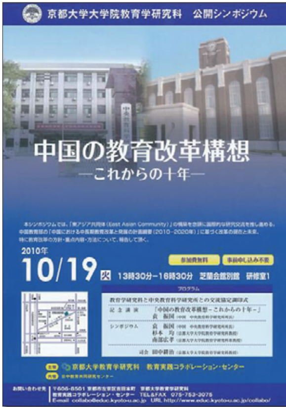
2010年度センター企画公開シンポジウム 「中国の教育改革構想—これからの十年」ポスター

Center for Collaboration in Innovation and Educational Practice