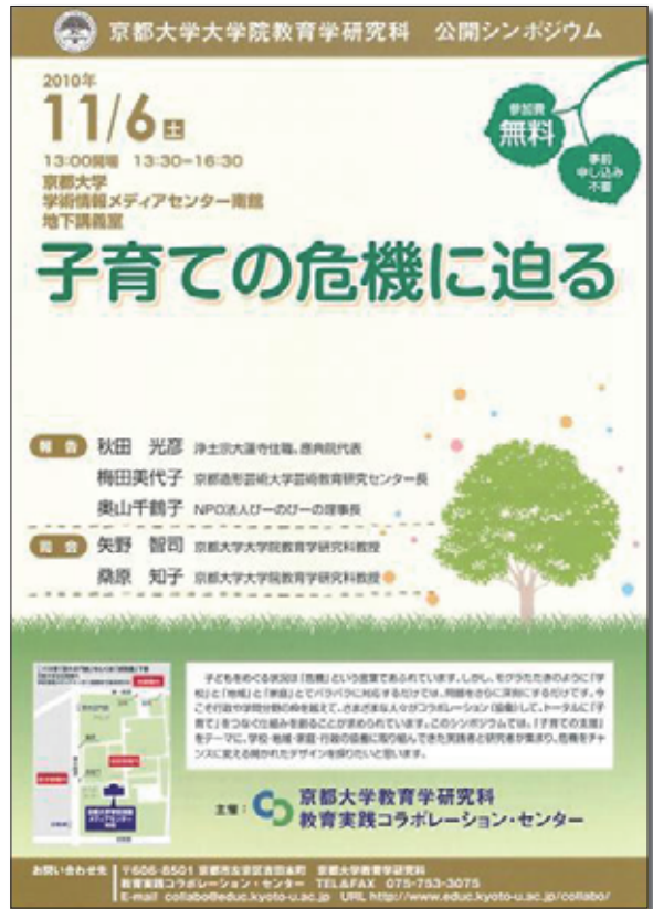
2010年度センター企画公開シンポジウム 「子育ての危機に迫る」ポスター