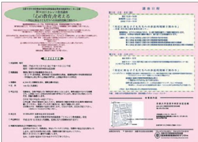
2010年度センター共催企画 第14回リカレント教育講座 チラシ