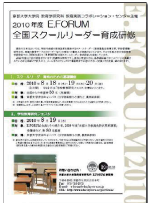
2010年度センター主催 E.FORUM 全国スクールリーダー育成研修 チラシ