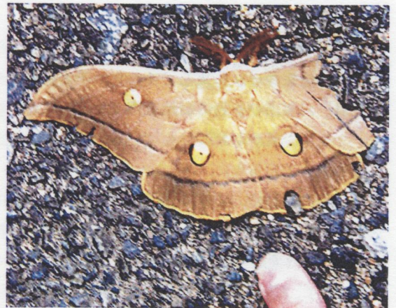
図2 夜間に明かりをつけた部屋(和歌山県白浜町)に飛び込んできたものの後翅が傷んで飛べなくなったヤママユ雄