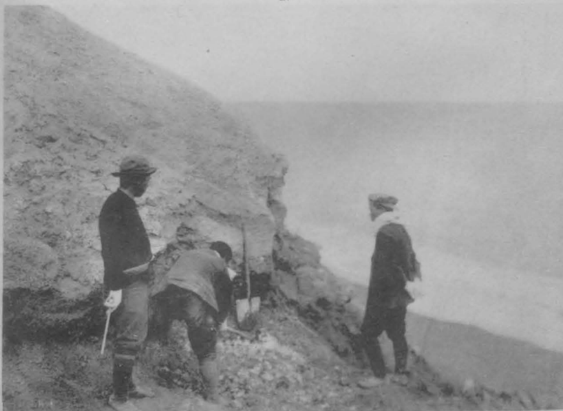
(山横) 氷石のクスイム端北太樺北