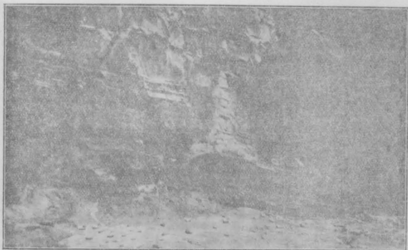
上總夷隅郡守谷Moriya 洞窟