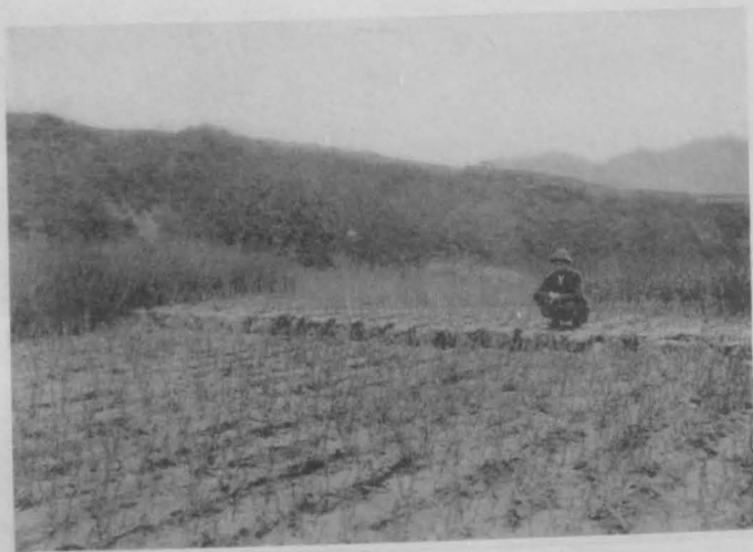
但馬城崎郡港村 ヒタ 田ノ斷層