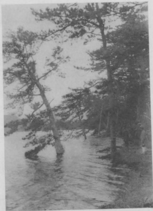
丹後竹野郡湊村砂丘ノ沈海