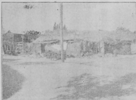
圖 八 第

阿の宮殿風のものが多かつたであらう。今日朝鮮の民家の屋根を見るに又この四阿である。附圖第八は京城内の文廟の隣で、予の撮影した鮮民の家で四阿の風である。但し今日のこつてゐる支那や朝鮮の宮殿は必しも四阿でなくて我國の紫宸殿の如くに大抵入母屋である、これは後節にのべる、漢唐を通じて格式の重かつた四阿の形が朝鮮の民家に残つてゐるやうに、我國にも民間に此屋根は多い。岡山市附近にはこの形の民家があつて