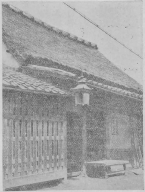
切妻平入 八幡町最古の家