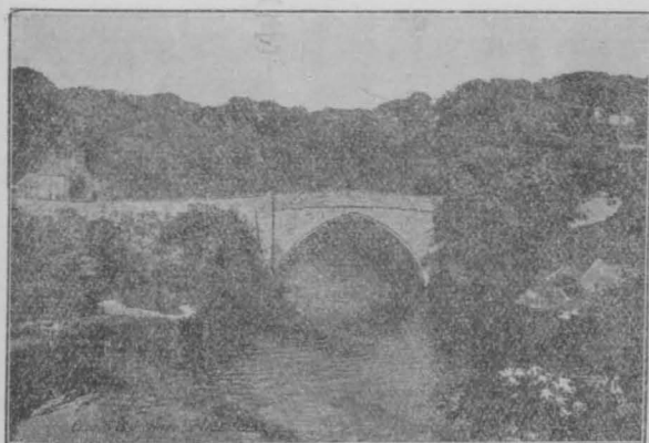
リゴルバ、オ、グツリブ

アバザーンは目貫きの場所ユニオン・ストリートに案内される。冷たい花崗岩の市の中心地である。この町には劇場、教會、圖書館の三つが相接して軒を並べてゐる。考へやうによつては皮肉である。修養の機關として現在未來過去の三世を貫いてゐる。E老人に従つて一々建物の内部を窺つて見た後老人の好意で、共同市場の書店に行くことになる。買ひ度い