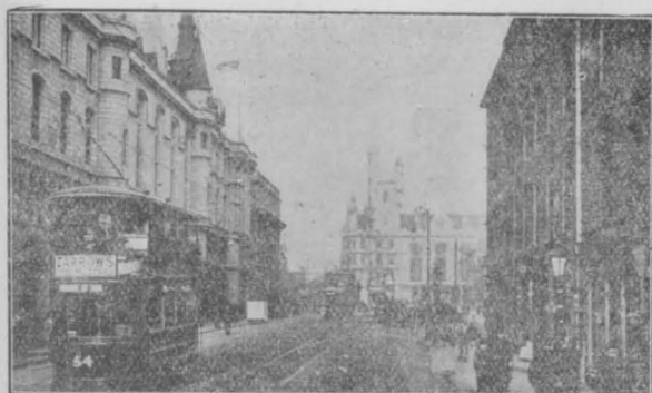
トーリトスンオニユ

家などは殆どないと云つても可なりである。従つて表通本通りの街路はどこへ行つても綺麗である。塵一つ留めぬ綺麗さはあるが何となく冷さがある。寸泥靴を没し、屋並みが見馴れぬで、板庇の上には寸餘の砂埃を堆積してある町家を見馴れて来た極東人の眼には一入の冷さを石造の家によつて感ずるそれは兎もあれ、花崗岩の都會を作つた材料の出所を見物すべく老人は案内して呉れる。花崗岩を採掘する石切場は峻しき山の中腹にでも