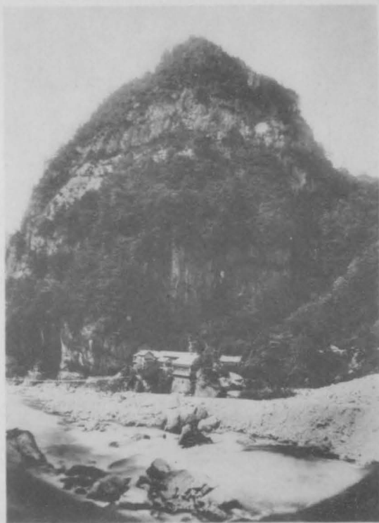
地球 第十三卷 第五版 黒部峡谷風景