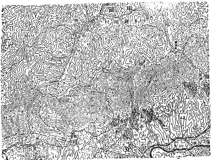
上野町北西斷層岸四近の地形圖（五萬分一）