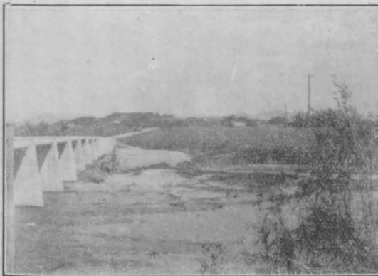
田長はるせ架を梁橋。町野上は街市の上層積洪方前に震地政安は地低積冲の間のと川田長と町野上。川耕てし轉移は今もしりあ落聚元で城區しぜ生の下沈。るなと地