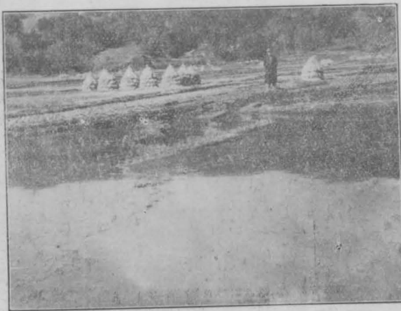
函南村田代盆地陥没中央部に於ける傾斜階段斷層