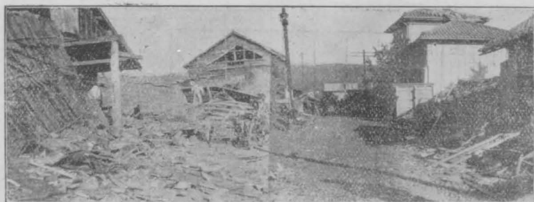
伊豆長岡驛前通の倒壊家屋を方西より望む

名は大仁線原木停車場の倒潰に依る。また伊豆長岡驛附近では凡そ三十戸ばかりであるが死者十九名を算してゐる。