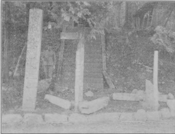
函南村代火雷神社鳥居の(東側の)北に移動せしむるを狀するよりの望む