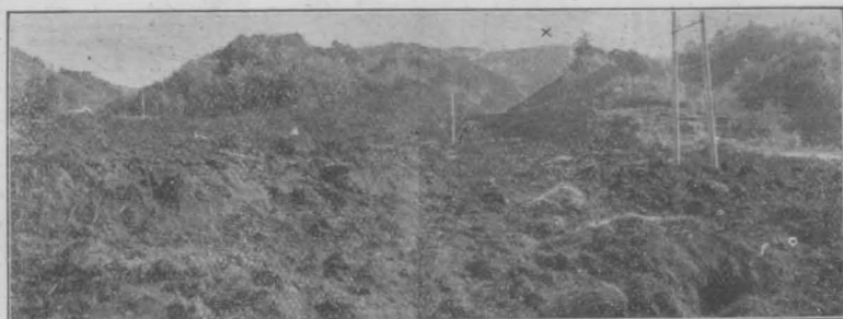
下狩野村梶山の津浪を西南より望む(×片瀬山)