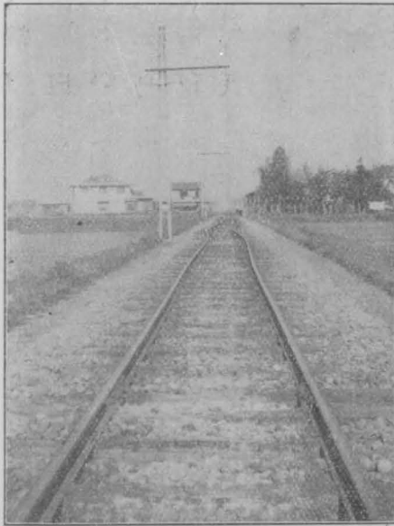
大仁線伊豆仁田驛の南方二十米の地の 路線を撓曲する南方より望む