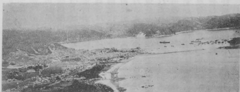
平頂の玄武岩臺地 (唐房灣岸の平頂の臺地を示す)

の小さな玄武岩臺地を作つてゐる。此の地帯の花崗岩の分布は主に松浦川下流左岸の山本附近から唐房灣岸に達し、西は有浦川中流に及ぶ一帯であつて、其の殆んど中央部を南北に玄武岩によつて被覆されて、花崗岩の地表による連絡は中斷されてゐる。そもそも此の一帯は小川博士の説によれば白堊紀から第三紀時代に遷る中間に於て大變動を生じ、筑紫山脈は西北方向に斷裂して背振、天山々塊と長崎縣西被杵半島との間に幅の廣い地溝狀の陥没帯を生じた。そして第三紀の初期から此處に海成層や陸成層が沈積して介化石や石炭層を夾む所謂第三紀層が廣い地域に互つて發達した。西北部の炭田は此の如く第三紀の古層中に含まれてゐるが、第三紀の新时期になつても淺海或は陸成の堆積は形成され、部分的には玄武岩の噴出もあつたのである。次いで南には多良火山の噴出があつたり、或は地盤の昇降運動も之に伴つて起つた。斯くて第三紀層地帯も浸蝕開析によつて地表は著しく彫