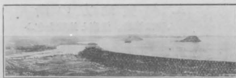
東松浦半島の玄武岩臺地

蝕によつて複雑化せるところあり、又或は、其の表面の弱線部を破つて火山岩の噴出があつたりして複雑になつたのである。然し大體に於ては起伏は少なく、凡そ百米乃至二百米の玄武岩臺地を構成してゐる。それは次の寫眞に明瞭である、即ち、遙か彼方に殆んど一線をなす山は皆玄武岩によつて被覆されたものであつて唐津灣内の島々も皆平頂である。