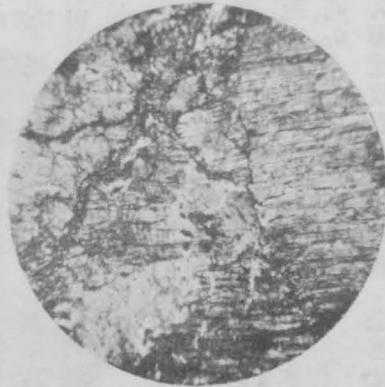
大日向村都澤の異剝岩

しくはない。これは进入岩塊が大なりし爲、岩漿进入時の壓迫を受ける事が少かつたためであらう。二次鑛物として蛇紋石、磁鐵鑛、方解石がある。