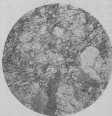
北相木村御座山の異剝岩