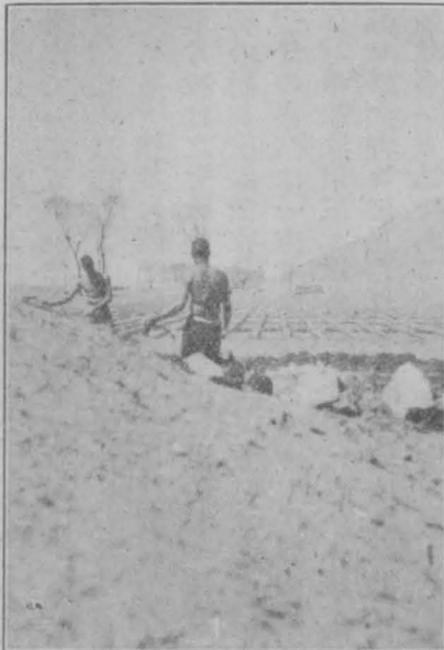
第七圖 水地 (赤峰縣歩々屯の鴉片畑)