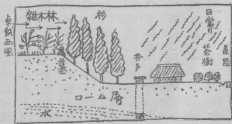
根岸村落の今福のスケツチ