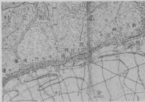
加治丘陵南麓の根通村落

第一圖は川越市南方の福原村附近の地圖で、道路の北側にのみ人家の並んだ片側村がよく發達してゐる。中福・上松原・下松原・上赤坂・下赤坂等は何れも片側村で、崖下の村落として前述した今福も片側村である。かゝる形態を有するに至つた理由は、平坦な臺地面に開拓した村落であることが主であるが、地形と密接な關係にあつて、北部と南部の侵蝕崖に並行した北東—南西の方向を取つてゐる。家は南東向で日當りのよい向にあるが、中福では南向の家も相當に多く、道路に斜に向いてゐるものも見受ける。道路の北側の家の所有する耕地が、道路