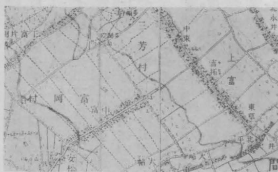
武藏野北部の開拓村……兩側村

の南側にあつて、其處に分家を出してゐるものもあるが、北側の家の日當りを妨害してゐる。北側に片側村を形成したことは更に日當りに關係してゐるので、地形と共に考察せねばならない。三芳村の下富は下富片側と呼ばれ、その特色に