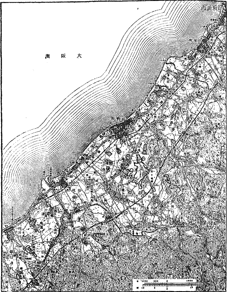
第一圖 俵屋新田分布圖