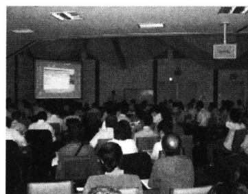
図2 シンポジウム会場

平成19年6月20日に開催された第72回生存圏シンポジウム「木質ラーメン構造の現状と今後の課題」は建築基準法改定後の混沌とした情勢もあって、木質構造研究コミュニティに属する研究者、業界担当者、行政担当者の注目を集め、木質ホール3階の大ホールと隣の会議室のパーティションを開放し、入場整理券を発行する程の賑わいであった(図2参照)。シンポジウムでは8名の演者が木質ラーメンに拘わる材料・接合・構造設計・法的扱い・その他の分野にわたって現状と問題点について講演し、200名を超える参加者との間で熱心な議論が展開された。