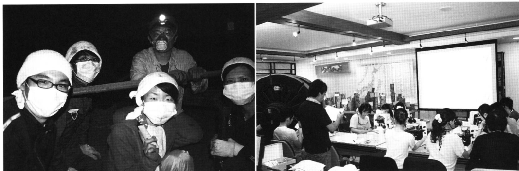
床下材のサンプリング（左）と樹種同定の講習風景