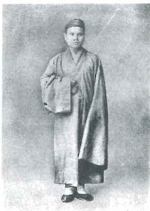
能海 寛 氏 肖像 日 十 二 月 二 十 三 日 攝 重 慶 郵 政 局 郵 政 局 印

私も、雲南や能海寛が辿ったところは通って、何百枚かスライドをとってきたのですが、それをここで流すときりがないと、他の方々が見せたいスライドをたくさん見せてくださっているの、今日はお話だけでいくことに致しました。能海寛、この人のことはもう伝記でたくさん出ていますので、あまり活字にならない、そして、私個人の極めて主観的なことを申しますので、漫談だと思って聞いておいてください。