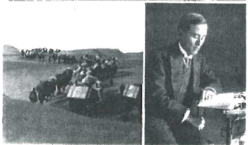
写真3 大谷光瑞とゴビ砂漠での大谷探検隊

もう一つの例を上げましょう。1920年代に、タリム川の中流が枝分かれして、ロブ・ノールの方に、昔の湖沼の方に流れて行って、ロブ・ノールが甦ります。それで「さまよえる湖」ということになったのですが、その時にヘディン門下のノーリンという地質学者が、水の戻ったロブ・ノールのところに行って詳細に調べてきました。是非世界中に知らせたいという思いで、英語の論文を書き、ジオグラフィカル・ジャーナル誌に掲載しようとした。その時にも、簡単には掲載されないだろうと読んで、元インド測量局長官だったサー・シドニー・バラードという人が一生懸命にこの論文を推薦してくれたのですが、それでもジオグラフィカル・ジャーナル誌には載らなかった