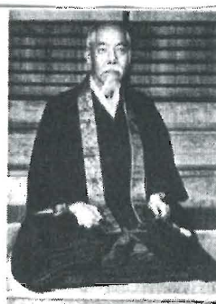
能海の師、南條文雄(晩年)