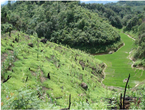
写真1 インド北東部、アルナチャル・プラデシュ州、ロアー・スバンシリ県 (Lower Subansiri) 県付近の谷頭部に展開する水田。水田を囲む斜面では焼畑が行われている。