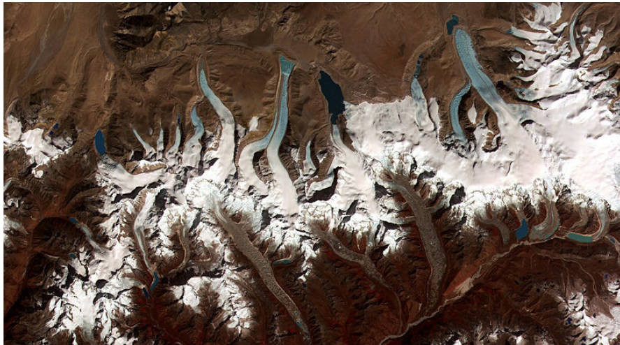
図1 ブータンヒマラヤ主脈の南北氷河と氷河湖 (東西 47 × 南北 32km の範囲の撮影。Terra 衛星 ASTER 画像 2002 年 6 月 4 日)