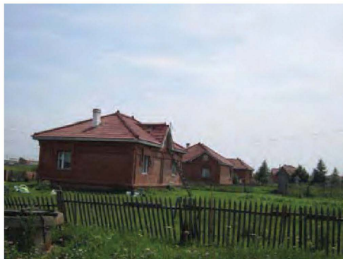
补图 6: 中亚朝鲜族所近年移居的农村“友好”