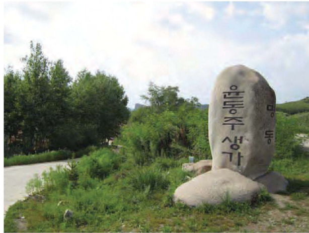
补图 5: 中国朝鲜族自治区明东村门口的石碑 (右侧文字为:“明东”。左侧文字为:“尹东柱的出生地家”。尹东柱位朝鲜族抗日诗人。)