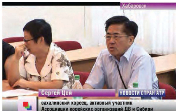
补图 7: 俄罗斯朝鲜电视〈亚细亚太平洋地方新闻〉

(13) 西川 (1992) (1998) 是他国民国家论方面的重要文献。之后他开始了“新殖民地主义论”——无领土的殖民主义的研究，西川 (2006) 是其成果之一。