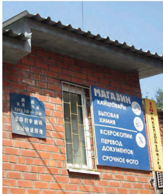
补图 3：新来中国人所开商店。