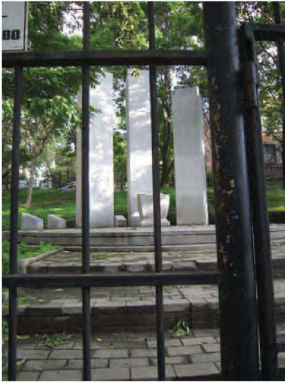
补图 4: 新韩村的纪念碑