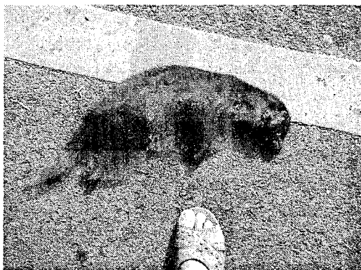
図 1, 2. 白浜町の海岸道路で 2006 年 8 月 2 日に目撃した事故死したニホンテン

Figs. 1, 2. Martes melampus melampus recently found as road-kills along a seaside road at Shirahama, Wakayama Prefecture, Japan on August 2, 2006.