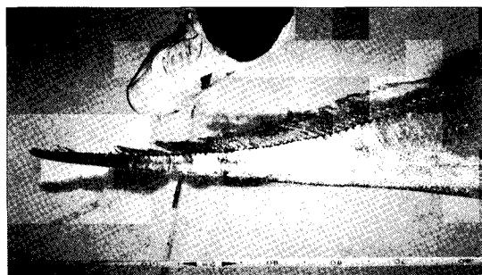
図2 図1で示した個体の尾鰭の取れた尾部 Fig. 2. Tail part of the same specimen of Trachipterus ishikawae shown in Fig. 1, lacking a caudal fin.