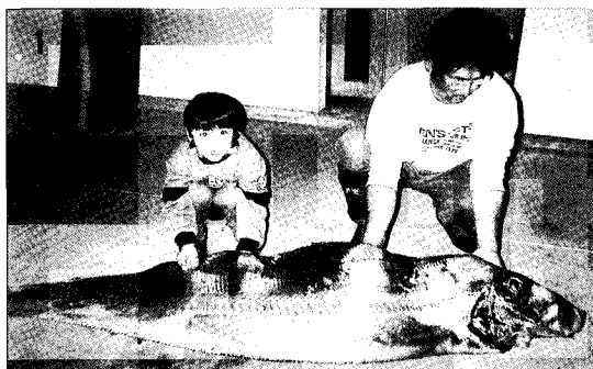
図1 和歌山県白浜町鴨居海岸へ出現したサケガシラ Fig. 1. Trachipterus ishikawae appeared at a coast of Kamoi, Shirahama Town, Wakayama Pref., Japan in January, 2004.