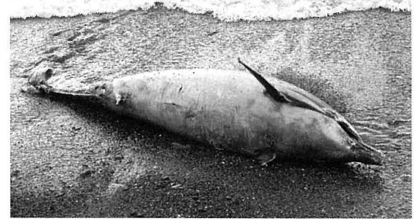
図3 和歌山県みなべ町埴田の二子の浜で座礁したスジイルカ