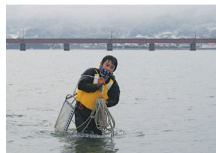
雪中の由良川河口における底生生物の収集

Symposium on Connectivity of Hills, Humans and Oceans (CoHHO): Integrated ecosystem management from Hill to Ocean」において、11件の成果を発表しました。プロジェクト最後の取り組みとなった最終報告会は、2014年3月5～6日に開催しました。発表のテーマは多岐にわたり、人工林の間伐に関するもの10件、シカ食害3件、溪流・河川水質8件、河口沿岸域の生物生産6件、木材流通2件、意識調査3件の計32件の報告があり、5年間に得られた成果に基づいて討議されました。間伐が及ぼす森林樹木と下層植生への影響や土壌栄養塩動態の応答、さらには渓流水質への影響について、多くの知見が得られています。より広域の河川水質に関しても、精力的な流域調査が実施され、流域の土地利用・土地被覆との関係が明らかとなってきました。また、沿岸海洋における生物生産にとって必須栄養元素である溶存鉄の動態に関しては、由良川流域において精査されるとともに、海洋植物プランクトンの生育に及ぼす溶存鉄と腐植物質の効果に関する研究が実施されました。自然科学における森里海連環学研究の一つのあり方を示すことができたと考えています。一方、社会調査に関しては、2度の意識調査が実施され、国産材に対する消費者の意識と森林所有者が森林に対して抱いている意識の解析が行われました。それぞれ、興味深い結果が得られており、今後、成果公表していきたいと思います。