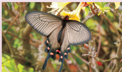
ツツジを吸蜜するジャコウアゲハ (北白川試験地)