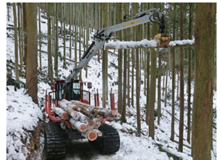
国産フォワーダによる搬出間伐検討会

熟・利用期を迎えています。林業の衰退によって担い手が不足しており、また急峻な地形ゆえにうまく木材を搬出する方法も確立されていません。そこで平成24年度に和歌山研究林の地権者であるマルカ林業株式