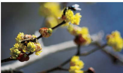
ダンコウバイ (芦生研究林)