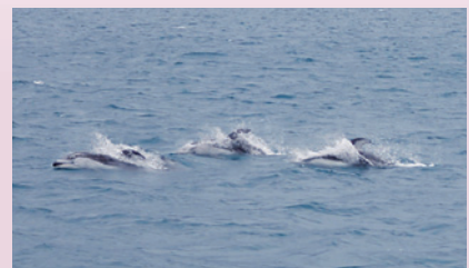
カマイルカの群れ丹後海に来遊 (舞鶴水産実験所)

http://fserc.kyoto-u.ac.jp/zp/nl/news33 この他にも季節の写真をご覧ください