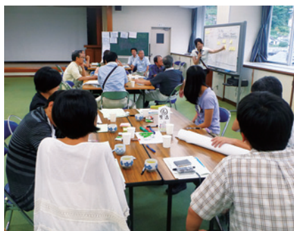
仁淀川町での住民ワークショップ

最終年度となった2013年度の主な取り組みは以下の通りです。8月24日に仁淀川町にて、住民ワークショップ「仁淀川町の未来を考える住民会議」を開催し、将来の森林流域と生活について約30名の地元住民の皆さんと討論しました。具体的な木文化社会像の創出には到りませんでした。共感による他者の理解」と「専門家からの情報提供」が地元の将来像を住民自ら考えるために重要な要素であることが示唆され