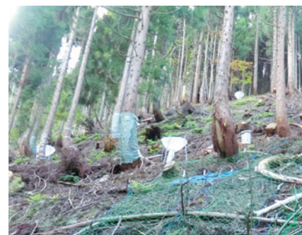
芦生研究林における間伐試験