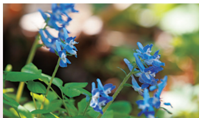
エゾエンゴサク (北海道研究林)