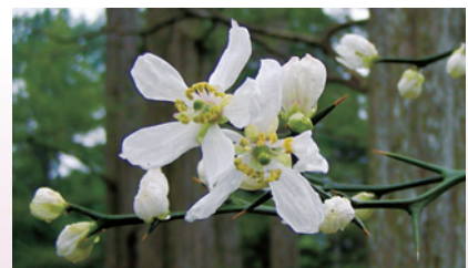
カラタチの花 (上賀茂試験地)