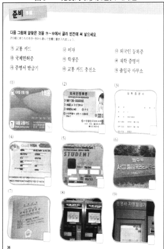
図3 発展的な多肢選択式問題

図3の「発展的な多肢選択式問題」では、単純な選択式ではあるが、取り上げている内容に特徴がある。従来の多肢選択式に比べて、より「真正性(authenticity)」が高い状況の中で、正答を決定するために求められる思考を刺激するように作成されている。ここでは、目標言語の文化的基礎知識、(1)から(9)までの項目の関係性の把握などをどの程度習得しているかが評価される。