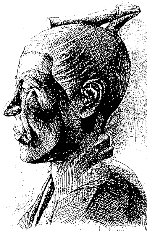
京都大学附属図書館所蔵:「吉田松陰」木像スケッチ