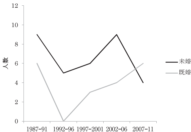
図2 P村における既婚・未婚別遠隔地婚出女性の状況

ところが、その後、公安がヨメ探し漢族男性の来訪を制限したことで、女性が婚出を決断する以前に漢族男性に出会うことは不可能となる。この頃には、遠隔地婚出によってすでに未婚女性の総数そのものが減少しつつあったこともあり、遠隔地婚出を望む女性の多くがラフ夫とのあいだに問題を抱える既婚女性に置き換わってきた。図2のグラフが示すように、ちょうどこの頃から、婚出以前に既婚であった者の遠隔地婚出が、未婚者のそれを上回るようになる。これらの女性が「夫を求めに行った」と言われることはなく、すべてが「ポイ」と表現されるのは、ラフ夫やラフ社会からの「ポイ＝逃亡」だと見なされているからである。遠隔地婚出を