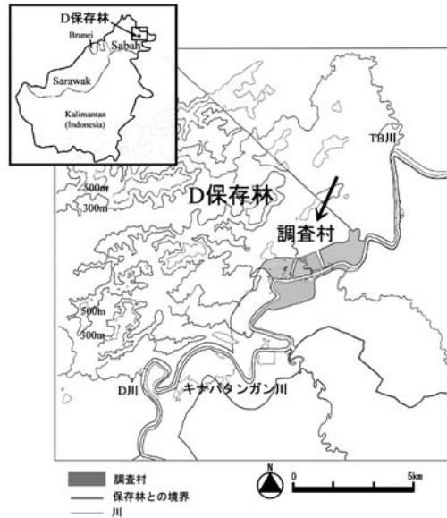
図1 調査地域 地図