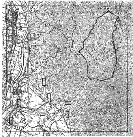
図3 関係6カ村の位置図

このことは、明治政府の林野政策とともに、体制転換の中での村方の動きをも合わせて考えねばならない問題であろう。