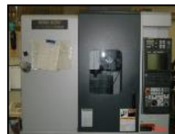
※ATC(Automatic Tool Changer) 工具自動交換装置のこと

マシニングセンタで可能な加工はNCフライスとほぼ同じだが、ATCがあるので、プログラムを入力することで複数の加工を続けて行うことができる