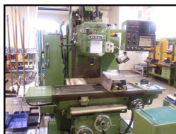
※NC(Numerical Control) 数値制御のこと