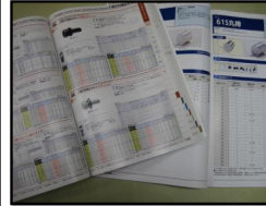
各種カタログも取り揃えています

図面を見てほしい 工作室の機械を使いたい 製作を依頼したい 部品や材料の購入を依頼したい