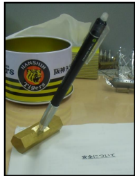
ペンスタンド付きペーパーウェイト

研究室配属後の4回生以上を対象に、ペーパーウェイトの加工を通じて、工作機械の使用方法等について再教育