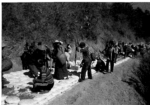
写真1 自助努力の似合うミャンマーの田舎でも道を直している

請人は国際開発コンサルタント2社とJVを組み、「日本発「土のう」による農村道路整備ビジネス」でガーナでのプロポーザルを作成し、91件の中から採択(20件)された。2012(平成24)年度までに採択された52件の調査の中で、NPOを主体とする準備調査は1