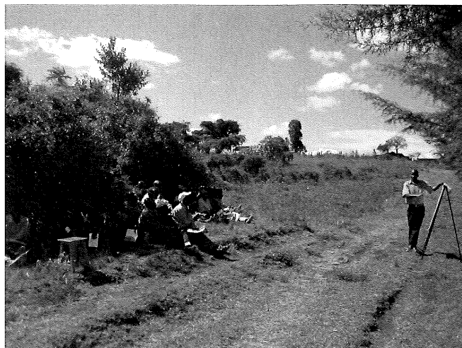
写真2 青空の下で次の発展に向けた農民研修

事業には簡易な施工機械（土運搬用のトラクターやプレートコンパクター）などの購入が必要であるが、事業開始後2年目までに黒字化でき、さらに10年間で総額約1・8億円の利益を創出できると試算している。農村の労働