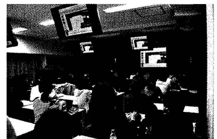
国際コンファレンス