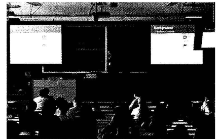
国際シンポジウム