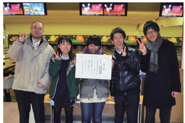
準優勝のNORIMO党 チーム(医学部附属病院)