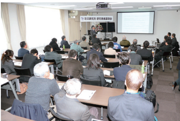
一般講演会場の様子