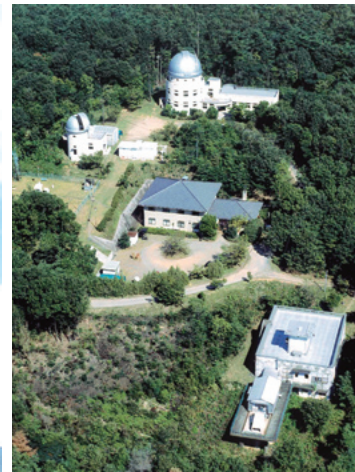
京都市の“京都を彩る建物や庭園” に選定された 理学研究科附属花山天文台 —関連記事 本文3871ページ—