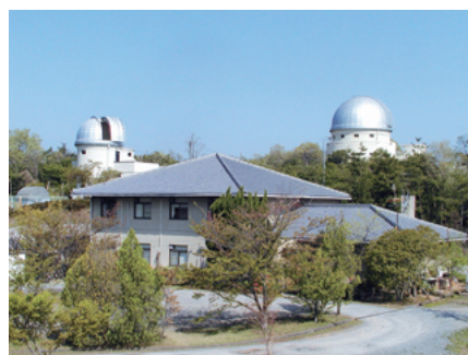
附属花山天文台外観

庭園について審査が行われ、新たに41件が選定されたが、そのうちの一つである。「昭和4年(1929年)の創立以