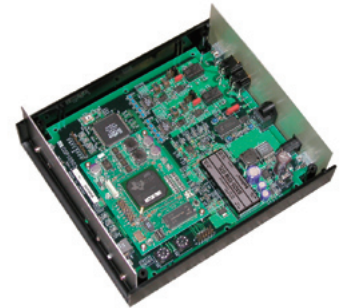
サンプル値制御理論を用いた高品位オーディオ用DAコンバータ試作機 (商用チップとは異なる)