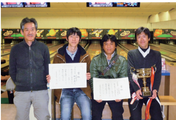
優勝のリアルガチ チーム(工学研究科)