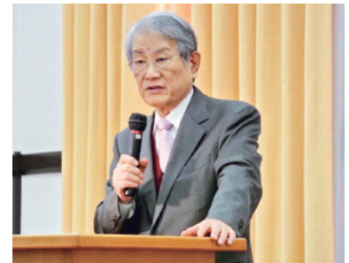
松本総長による歓迎の挨拶

本学からの2名の職員を含む、各大学の参加者によるプレゼンテーションに続いて、セッションごとに活発な議論が繰り広げられた。大学の国際化を推進するために必要な事項、またその実現に向けての問題意識を共有したうえで、国際交流の実務担当・責任者が具体的な意見を交わすことにより、国内の諸大学とアジアの主要大学とのネットワーク構築を強化するとともに、各大学がより発展的な国際交流活動を実践していくことが期待される。