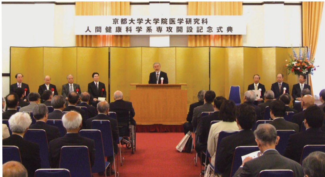
医学研究科人間健康科学系専攻開設記念式典 —関連記事 本文2406ページ—