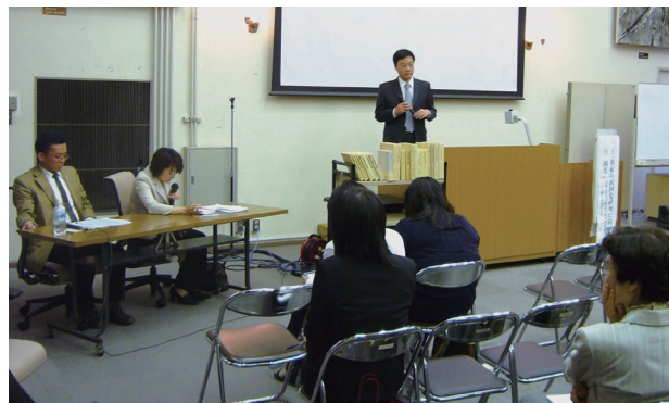
汪朝光 中国社会科学院近代史研究所研究員・民国史研究室主任の講演