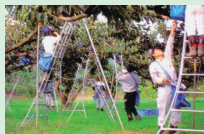
果樹園での学生実習

主として農学部2回生を対象に、週2回(月曜組および水曜組)の「栽培技術論と実習」を開講しています。学生の実習に対する関心は高く、多くの受講希望者がいます。実習では、その日の実習に関する講義の後、水田ではイネ・ダイズ、果樹園ではナシ・モモ・カキ、蔬菜畑・施設ではダイショ・タマネギ・アスパラガス、花卉温室ではカーネーション・コチョウラン・アジサイなどの栽培に関する種々の実技指導を行っています。