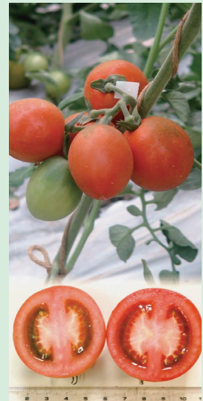
実験材料の単為結果性ミニトマト

京都農場では，主に農学専攻所属研究室の不可欠な実験圃場として活発な教育・研究が展開され，国際的にも評価の高い多くの研究成果が得られています。