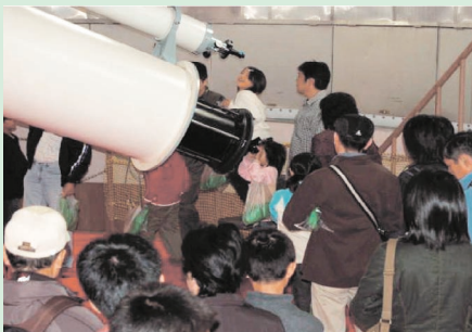
飛驒天文台での天体観望の様子

理学研究科附属天文台では平成11(1999)年から毎年一回一般公開を行っており，今年度は平成18年9月30日(土)に花山，飛驒の両天文台で実施しました。今回の主な企画は，1)花山天文台のザートリウス18cm屈折望遠鏡，70cmシーロスタット太陽望遠鏡，45cm屈折望遠鏡や飛驒天文台の太陽磁場活動望遠鏡，ドームレス太陽望遠鏡，65cm屈折望遠鏡等の設備やそれを用いて得られた最新の研究成果の紹介，2)テレビ会議システムを利用して両天文台をつなぎ，飛驒天文台で撮られている太陽画像をリアルタイムで解説するデジタルライブ，3)より一般的で基礎的な天文学の講演や解説ポスターの展示，ポスターを見ることで正解の分かるクイズラリー，4)廃棄CDを利用して分光器を作って色々な光を覗いてみる等の体験もの，5)計算機による天体現象のシミュレーション解説，6)45cm屈折望遠鏡(花山)や65cm屈折望遠鏡(飛驒)等を実際に目で覗く天体観望でした。今回は幸い好天に恵まれ，昼は太陽，夜は月のクレーターや木星の縞模様，木星の周りのガリレオ衛星などをしっかり見る事ができました。