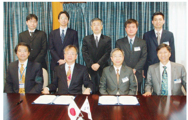
河田所長(前列左から2人目)と鄭院長(前列右から2人目)