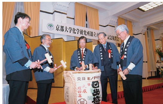
記念祝賀会での鏡開きの様子

この記念行事の開催は、研究所のこれまでの歩みを振り返り、今日の時代における化学研究所のあり方や、今後の指針への足がかりとなる「化学研究所のアイデンティティ」を再確認する好機であったと捉えている。