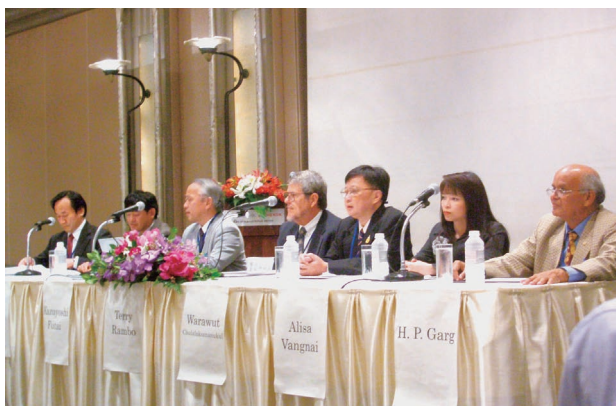
3日目の総括パネル討論