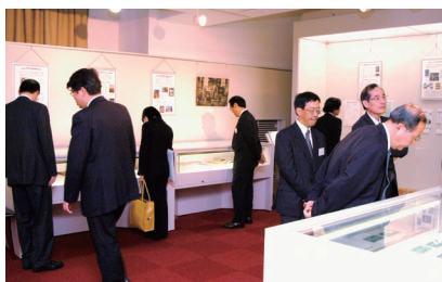
「終わりになき知への挑戦」の展示