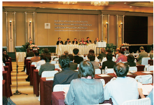
第8回国際シンポジウムを開催 —関連記事 本文2290ページ—