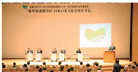
百周年記念ホールでの対話集会

り説得力と切実感にあふれた意見が交わされた。本集会の特徴の一つである講演者やパネラーとフロアとの対話では、高知や新潟などからの参加者から質問が相次いだ。