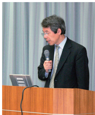
挨拶する堀井教授

宇治キャンパスで、5月18日(木)午後2時から新たに研究所・事務部に配属・採用された大学院生，4回生，教職員等を対象に安全衛生教育を実施した。