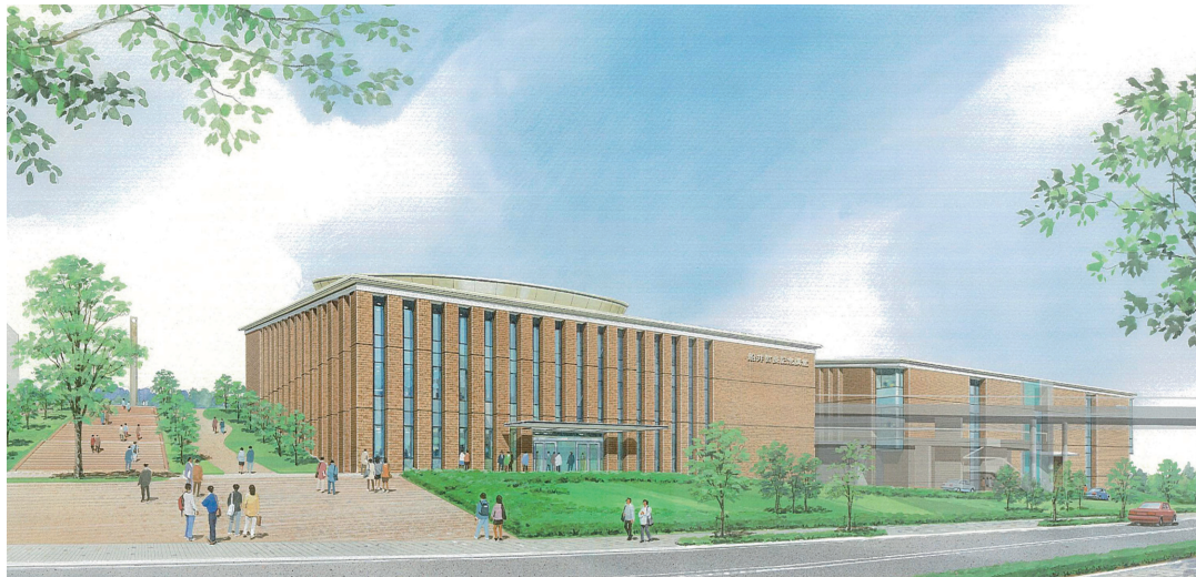
船井哲良記念講堂 —関連記事 本文2177ページ—