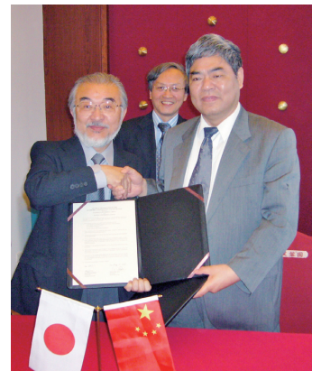
尾池総長と洪銀興校務委員会主任

南京大学は、1902年に設立された高度な学術レベルをもつ研究中心型の総合大学で、著名な学者や政治家を多く輩出している。人文科学、社会科学、自然科学、生命科学等17学部、52学科を有し、教員は2,000人、学生は41,600人を数える。