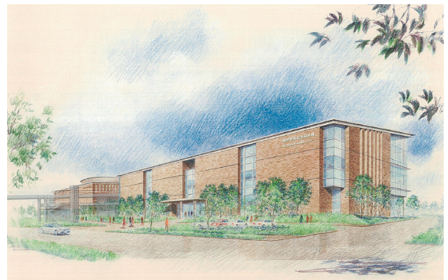
船井交流センター