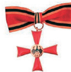
Das Verdienstkreuz am Bande (Damenausführung)

ドイツの勲章制度は1951年に再開され、現行制度は1966年から運用されている。功労十字小綬章は、最初に受けることのできる勲章のうち上位のもので、原則として40歳以上の者を対象とする。