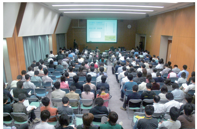
安全衛生に関する講習を熱心に受講する参加者

宇治事業場総括安全衛生管理者である堀井文敬化学研究所教授の挨拶の後、衛生委員会委員等の講師により「安全衛生管理体制」、「化学実験および化学物質管理」、「生物実験および放射線取扱」、「物理実験および計算機関係」、「フィールドワーク関係およびリスクへの対応」、「廃棄物および排水」、「喫煙問題」について、安全の基本