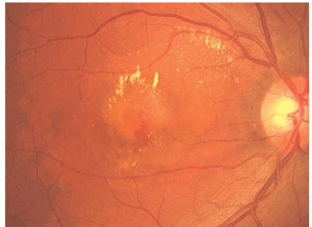
眼底に加齢斑黄変性がみられる症例