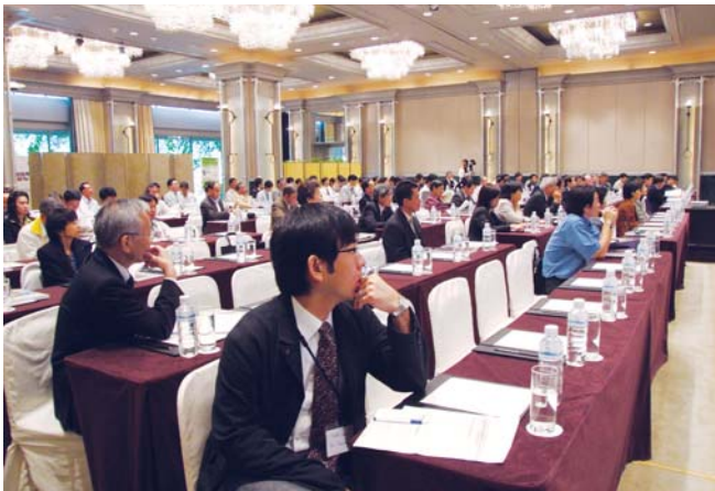
第7回京都大学国際シンポジウムの様子