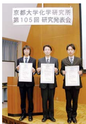
所長賞と同賞学生奨励賞を受賞した3名

本研究所は、化学研究所の特長である“化学を中心とした広い自然科学分野”にわたる最先端の研究結果が発表され、それぞれに熱心な聴講と活発な討論が行われた。終了後は、研究発表会懇親会が宇治生協会館にて、教職員200名の参加を得て盛大に行われた。