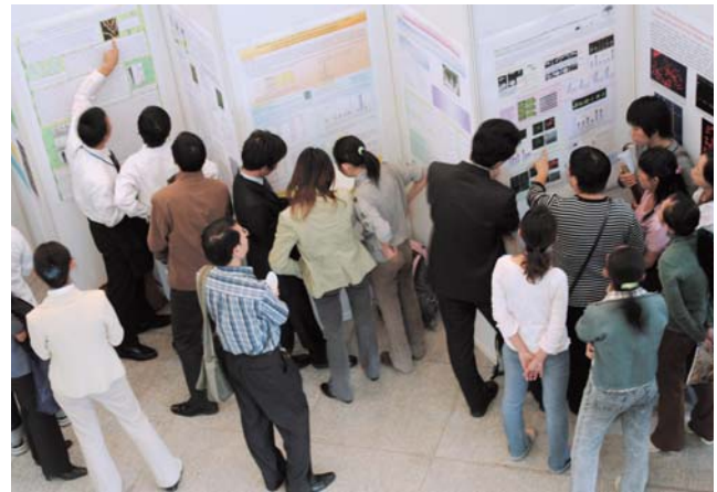
第6回京都大学国際シンポジウムのポスター発表