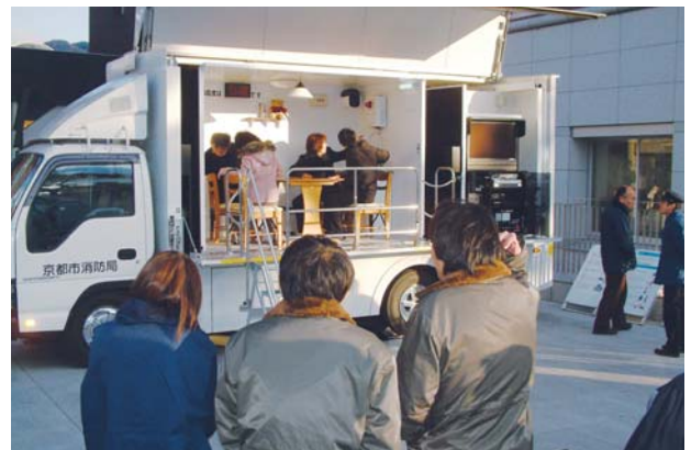
起震車による地震体験