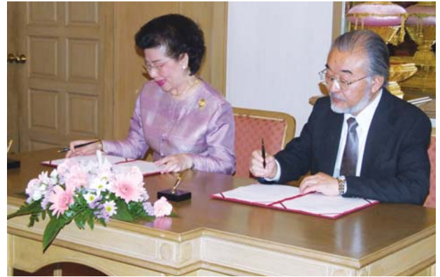
尾池総長(右)とSuchada Kiranandana学長

同大学は、1917年に設立されたタイで最も歴史のある大学。文学部、理学部、商学部、医学部、工学部、法学部等の19学部、大学院を有する総合大学。教員は2,500人。学部学生は14,000人。院生は5,200人。ホームページは http://www.chula.ac.th/cuweb_en/