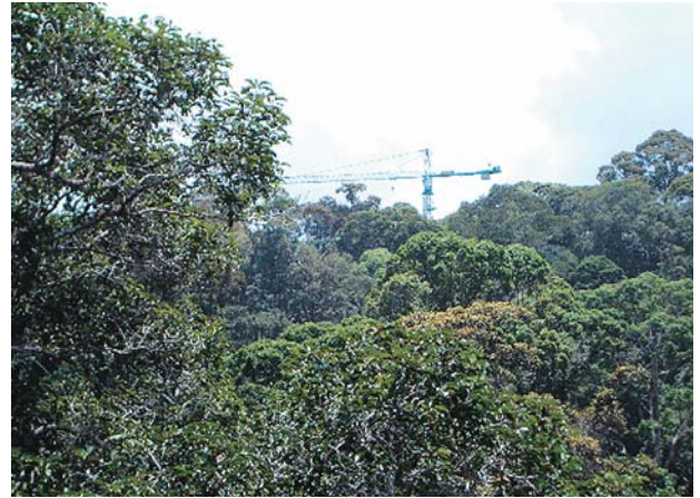
ランビル国立公園の熱帯雨林とその林冠に研究者が直接アクセスするための林冠クレーン。85メートルの高さがあり、世界に9基設置されているものの中でも最大級である。

平成17年11月29日（火）～30日（水）に、ボルネオのマレーシア・サラワク州クチン市で「森林生態、水門気象学と森林生態系リハビリテーション」をテーマに国際シンポジウムが開かれた。このシンポジウムにあわせ、日本の研究者らで組織する日本サラワク熱帯林研究コンソーシアムとサラワク森林