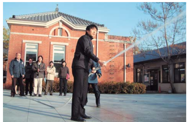
屋内消火栓による放水訓練