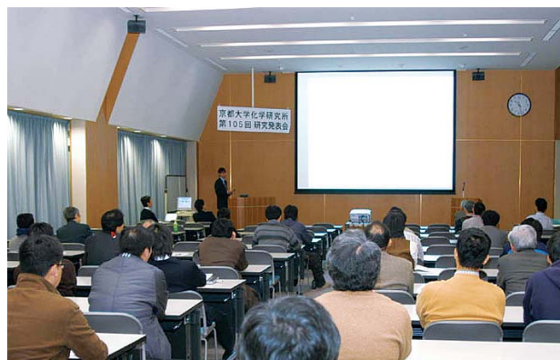
研究発表会場の風景