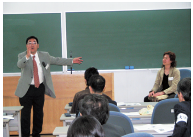
第1回京都大学・大阪大学合同イベント —大学が変わる みんなで変える— —関連記事 本文1937ページ—