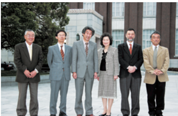
畠山ご夫妻(中央)を囲んで