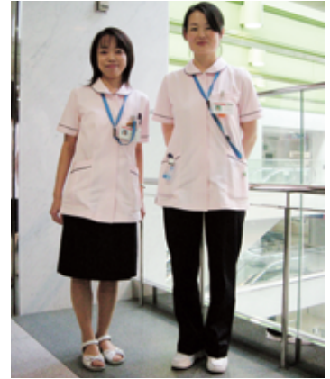
看護服の上着は、白とピンク 下は、伸縮式の紺のスカートかパンツロン