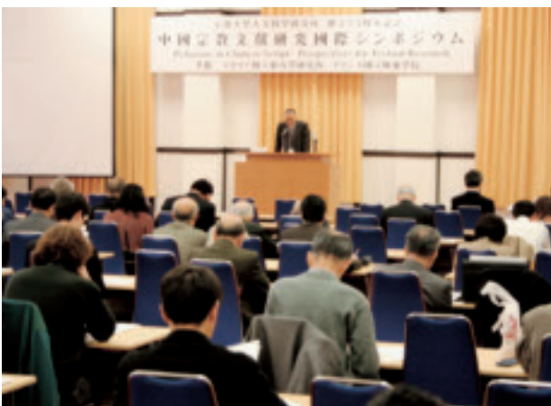
時計台記念館のシンポジウム会場