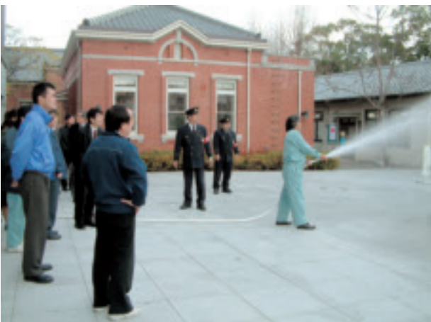
職員が屋内消火栓を体験