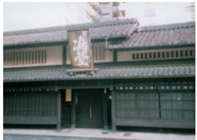
町家「嶋臺」の建物正面