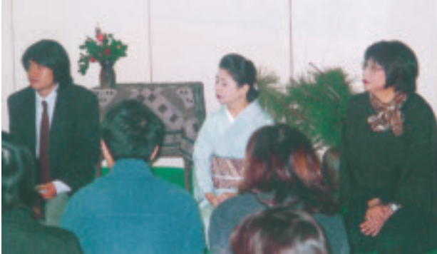
当日の講師3名・参加者ら

地球環境学堂では、さる平成16年11月29日（月）夕に、第1回の「はんなり京都嶋臺塾」を、東洞院御池にある町家で開催した。