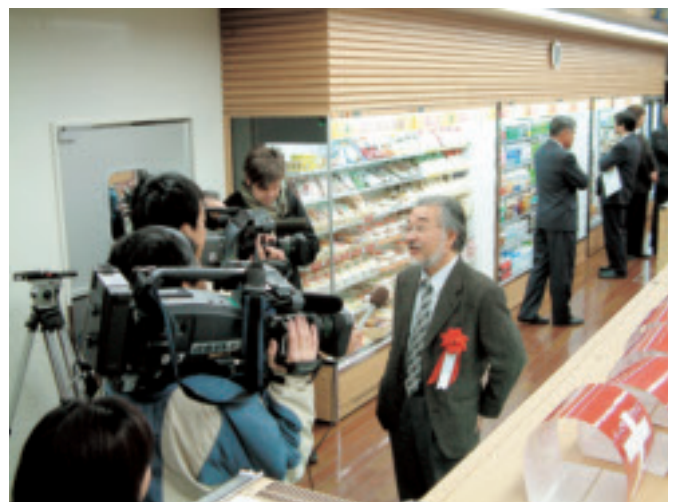
吉田南構内に コンビニエンスストアがオープン —関連記事 本文1834 ページ—