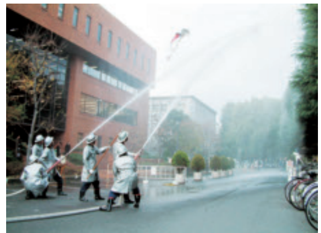
自衛消防団による消防演習風景