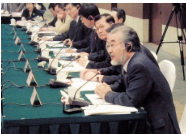
第3回日中学長会議にて発言中の総長

日中学長会議は、日本の7国立大学と北京大学をはじめとする中国の8大学により、日中両国の高等教育分野における協力の促進を目的として、平成12年10月に東京で開催されたのが発端となっている。第2回には早稲田大学と慶應義塾大学が加わり、平