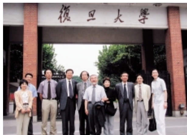
復旦大学正門前にて

http://www.kyoto-u.ac.jp/uni_int/01_sou/speech.htm