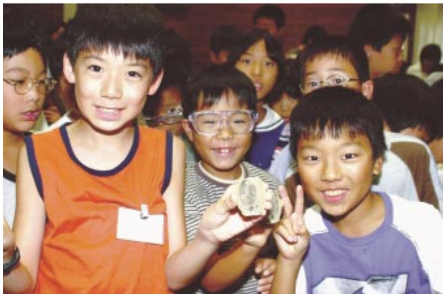
三葉虫に眼を輝かせる子供たち