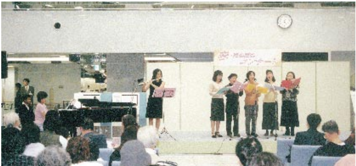
春・ほのぼのコンサート 関連記事本文866ページ