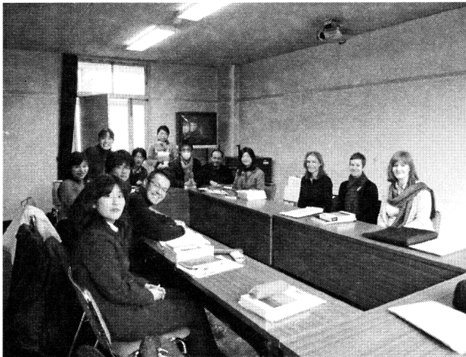
ロンドン大学教育研究所の大学院生との交流