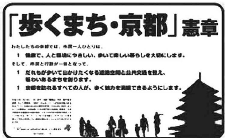
「歩くまち・京都」憲章 広報ポスター

「既存公共交通の取組」は、バリアフリー化や、乗り継ぎの分かりやすさなどで、バス・鉄道の利便性を向上させるのが主な政策内容である。一例として、洛西地域におけるバス利便性向上に向けて、これまで、交通事業者が独自のダイヤ編成や案内表示をしていたが、京都市が洛西地域を運行する複数の交通事業者に連携を呼び掛け、事業者の枠を超えたバスダイヤの編