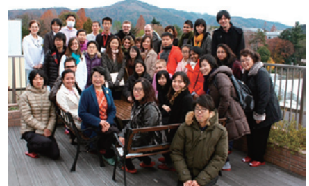
「北白川の花の家」屋上にて

若い世代の参加者からは、「プレゼンテーション後に参加者からフィードバックをもらえる機会は、今後の研究の為に役に立つと思った。また、