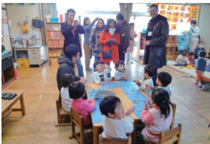
高野川保育園を見学する参加者たち

8日には、フィールドワークとして、市内の「高野川保育園」と日本ののちの花協会が運営する有料老人ホーム「北白川の花の家」を見学し、子どもたちや高齢者と交流体験をもった。「高野川保育園」では、