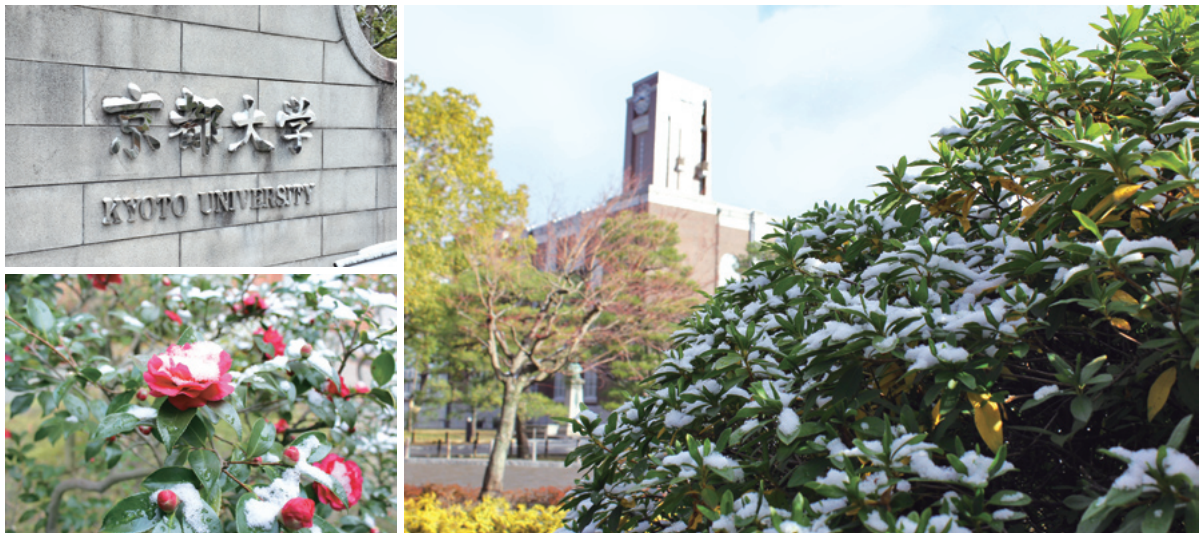
雪の大学構内風景