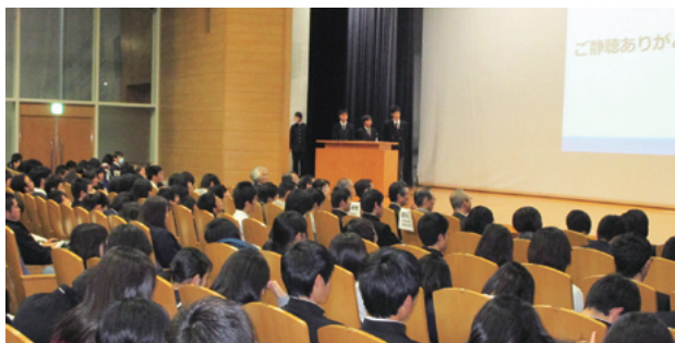
高校生によるプレゼンの様子(大阪府)

GLHS(進学指導特色校)10校とともに「京都大学キャンパスガイド」を百周年時計台記念館で開催。代表生徒による研究成果発表、本学教員による講評、明和政子 教育学研究科教授および山下 潤 iPS細胞研究所教授による講演、各学部の協力のもと学部紹介や模擬授業を実施。