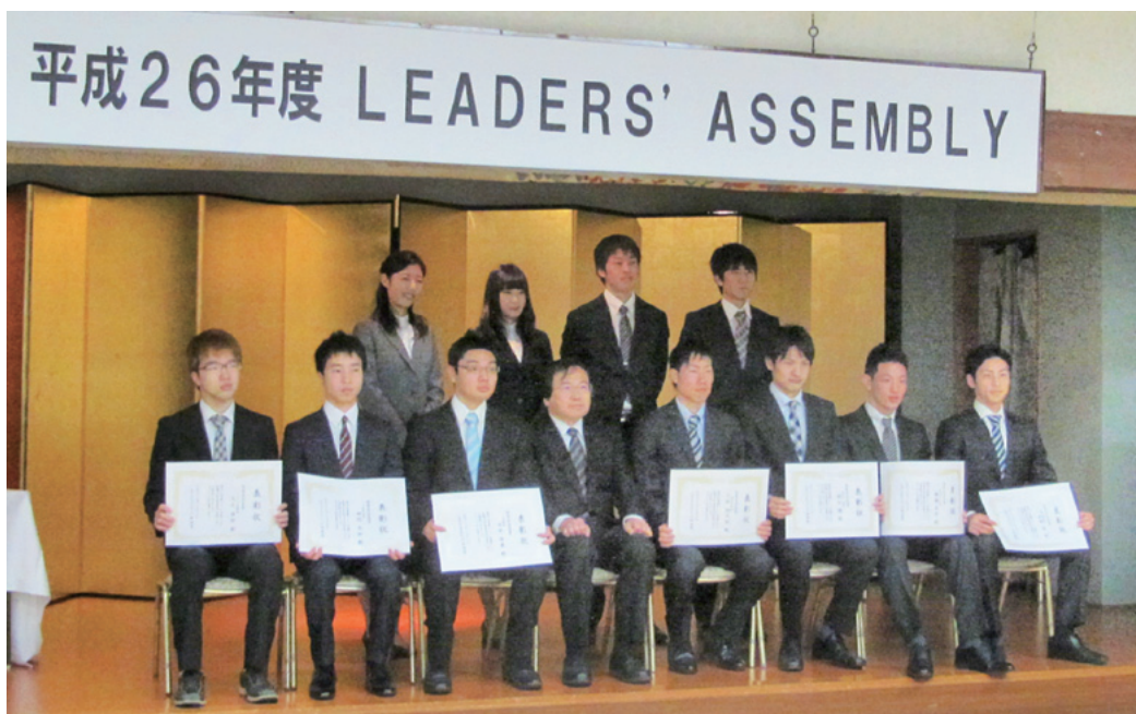
体育会会長賞、体育会優秀賞の受賞者