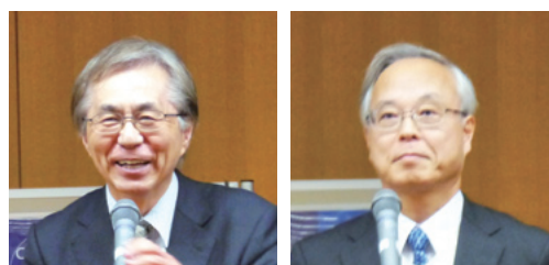
新年の挨拶を述べる岸本所長(左)、乾杯の音頭をとる大志万所長 (宇治地区事務部)

その後、出席者は銘々に歓談し、新年を迎えた実感と賑やかな雰囲気の中で盛会のうちに閉会となった。